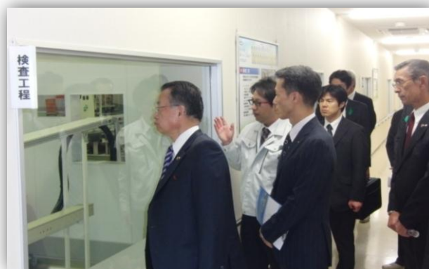
検査工程の説明を受ける山本大臣（左）